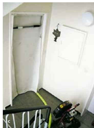
Illustrations 6a-c: incendie d'appartement le 6 février 2006 à Heilbronn.