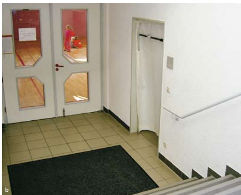
Illustrations 4a et b: exemples d'utilisation typique d'une obturation mobile de protection contre la fumée.