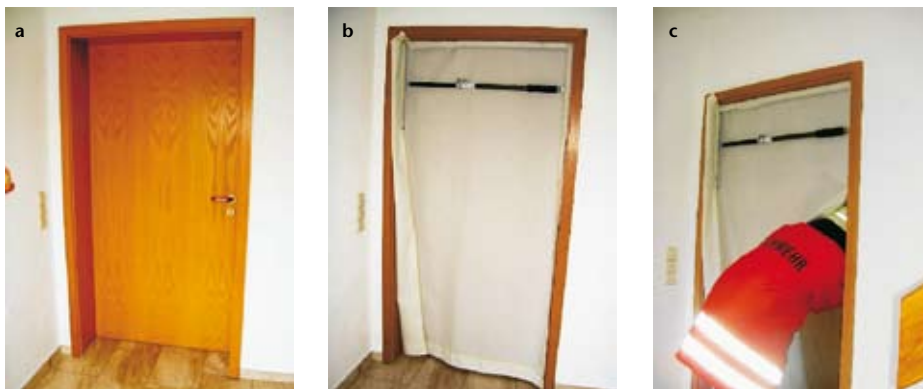
Illustrations 3a-c: système d'obturation mobile de protection contre la fumée pour les sapeurs-pompiers