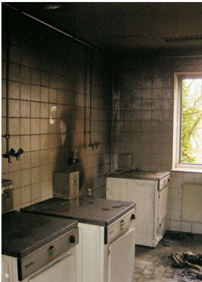
Illustrations 5a et b: incendie d'un sèche-linge le 3 novembre 2005 à Göppingen.

Le tissu difficilement inflammable obture parfaitement la partie supérieure de la porte, empêchant la propagation de la fumée. Ce tissu est fixé au cadre métallique au moyen de bandes velcro; sa coupe et sa rigidité ont été choisies pour qu'il puisse être mis en place de manière idéale rapidement et simplement, indépendamment de la largeur de la porte. Le tissu, la bande velcro et les coutures sont exécutés de manière à résister aux températures attendues à la limite de la couche de fumée et dans le secteur d'entrée, au contact de la porte d'un appartement.